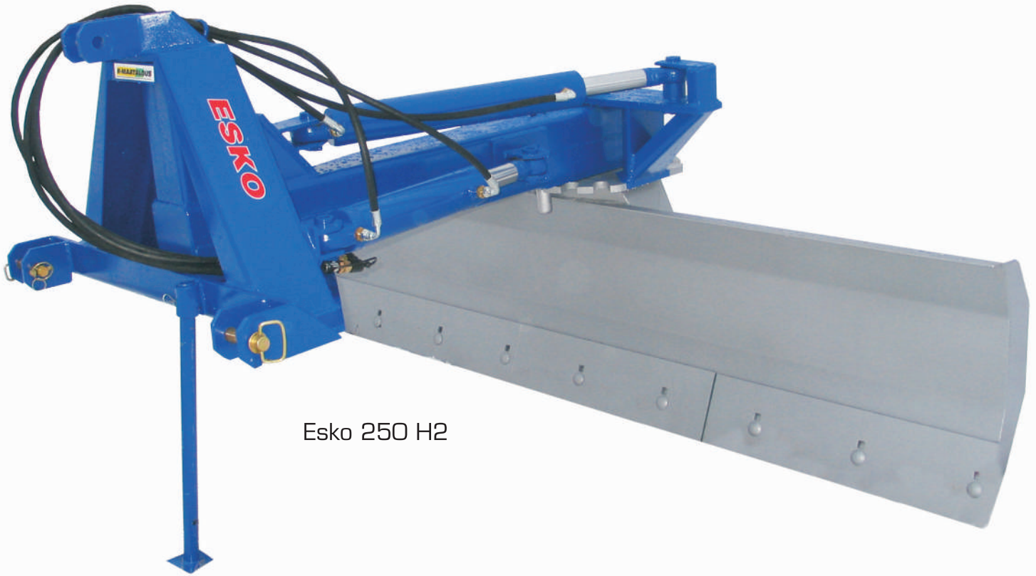
Esko 250 H2

Esko 250 H2 lanassa teränkääntösyylinteri on rungon yläpuolella. Toiselta puolelta hammastettu terä on vakiovaruste.