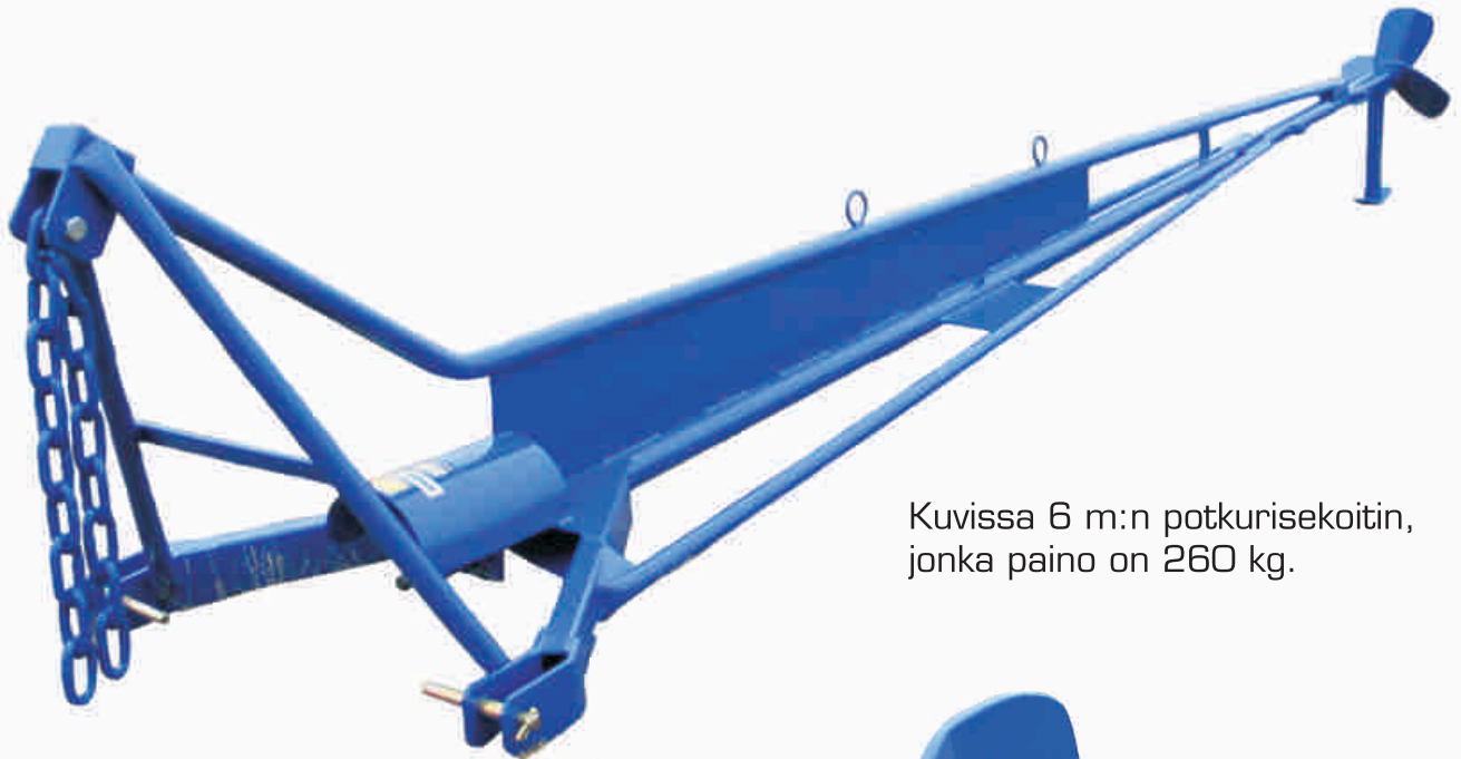
Kuvissa 6 m:n potkurisekoitin, jonka paino on 260 kg.