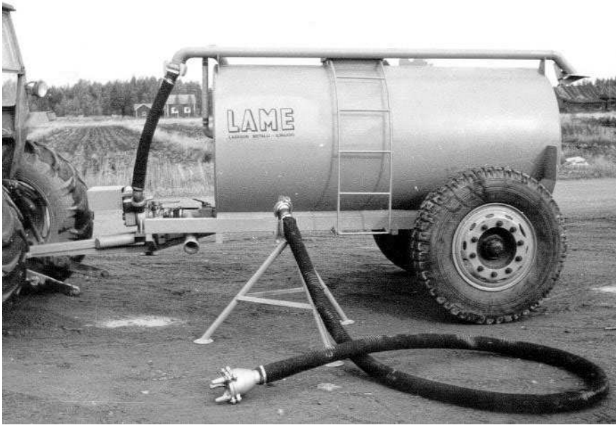
Virtsanlevitystä varten valmistettiin edullista 2700 litran imevää vaunua.