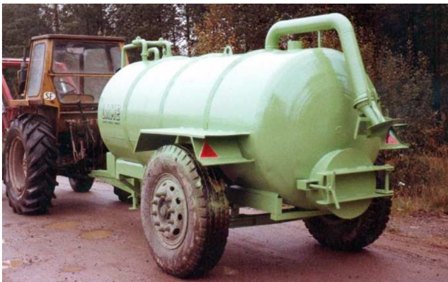
Lietevaunut olivat vihreitä, kun ensimmäinen imupainevaunu valmistui 70 luvun lopussa.