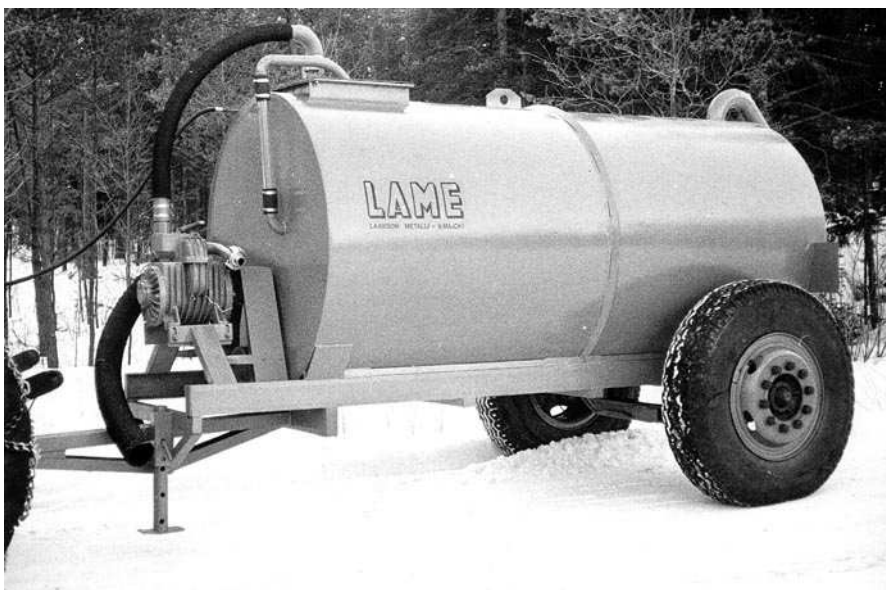
Levitysvaunusta tehtiin imevä versio lisäämällä siihen tyhjiöpumppu.