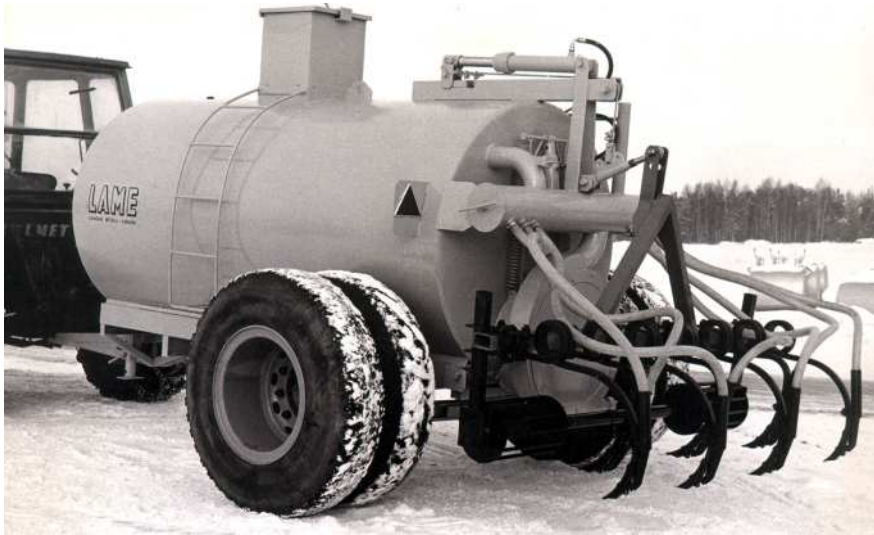
Multauslaite 60 luvun loppupuolelta.