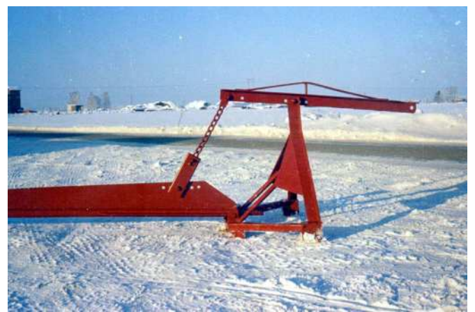
Potkurisekoittimien valmistus alkoi 60 luvulla ensimmäisenä Suomessa.