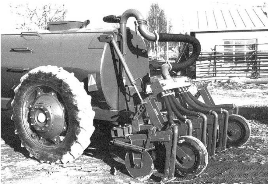
Multauslaite 70 luvun lopulta.